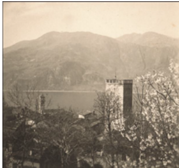
Vista di Maggiana con il campanile di San Rocco e la torre