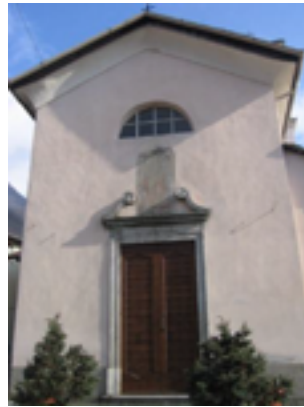
La chiesa di San Rocco a Maggiana