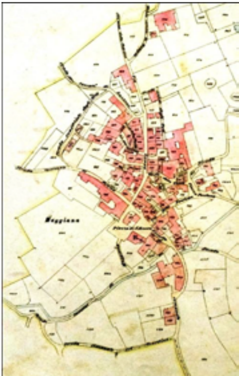
Nucleo di Maggiana nel 1860 (mappa Archivio di Stato di Como) e oggi