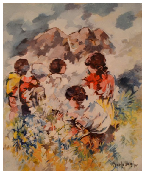
A sinistra: La Vergine dei monti , in centro Natura morta , a destra Fanciulli in montagna (scheda a cura dell'Archivio Comunale Memoria Locale ODV-Mandello 2020)